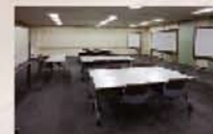
研修室・会議室が6部屋あるほか、レストラン、宿泊施設、大・小浴室、テニスコートやスカッシュコートなどのスポーツ施設も完備されている

ユーザーデータ セミナーハウス常総様 所在地/茨城県つくばみらい市絹の台4-4 設立/平成4年 ホームページアドレス/ http://www.seminarhouse-joso.co.jp 主な業務内容 ●企業、団体、学校・研究機関などを対象とした総合研修施設の運営・管理