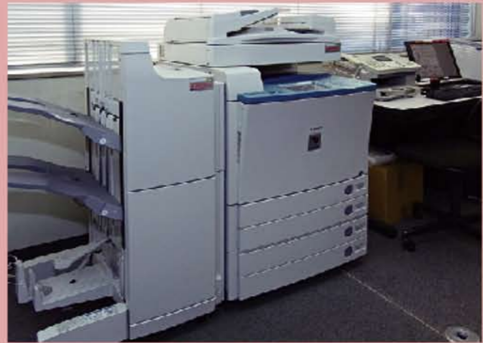
設備の修理履歴や顧客情報を一元管理することで誰もがアクセスできる。担当者が不在でも瞬時に対応できるようになった